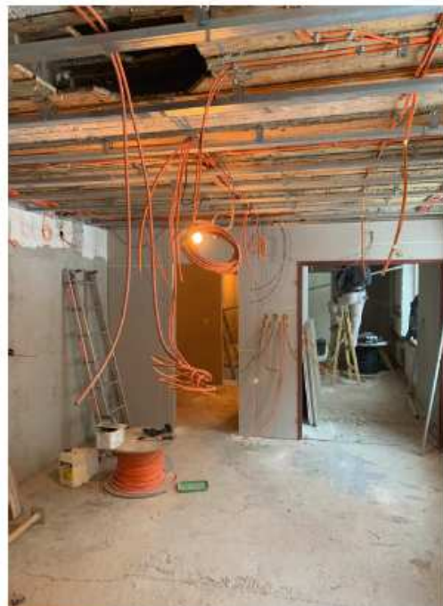
Rekonštrukcia priestorov gynekologicko – pôrodnického oddelenia.