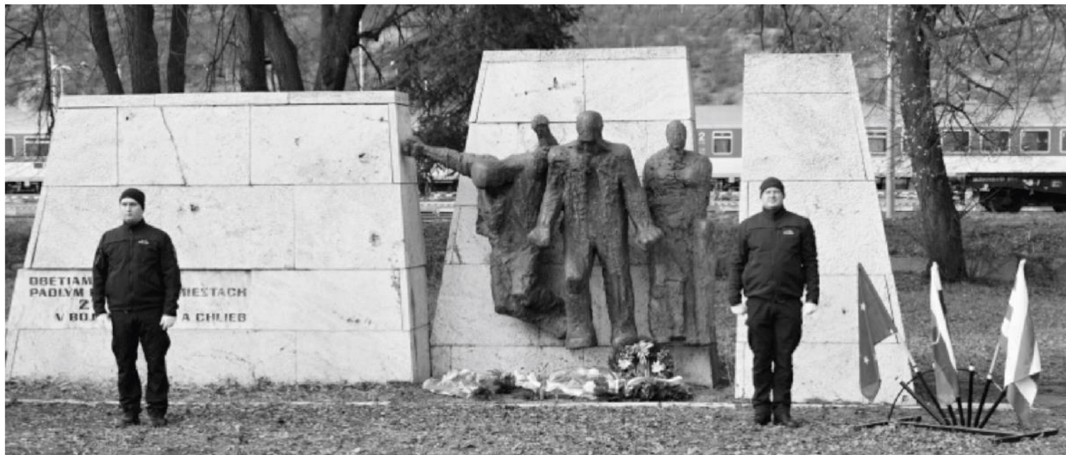
Krompašania spomínali na udalosti Krompašskej vzbury.