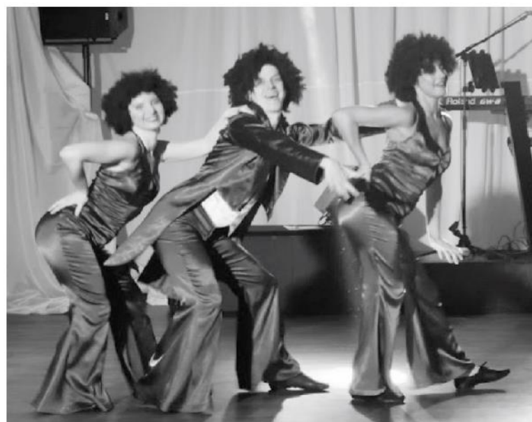
Hudba a tanec 80-tych rokov.