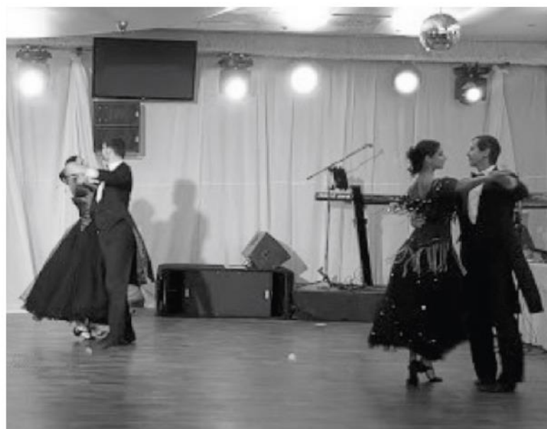
Otvárací tanec plesu.