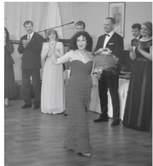
Charizmatická speváčka sálu hotela Plejsy poriadne roztancovala.