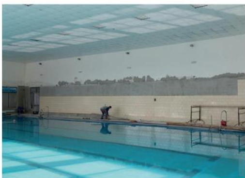
Obklady pri bazénoch sú nové.