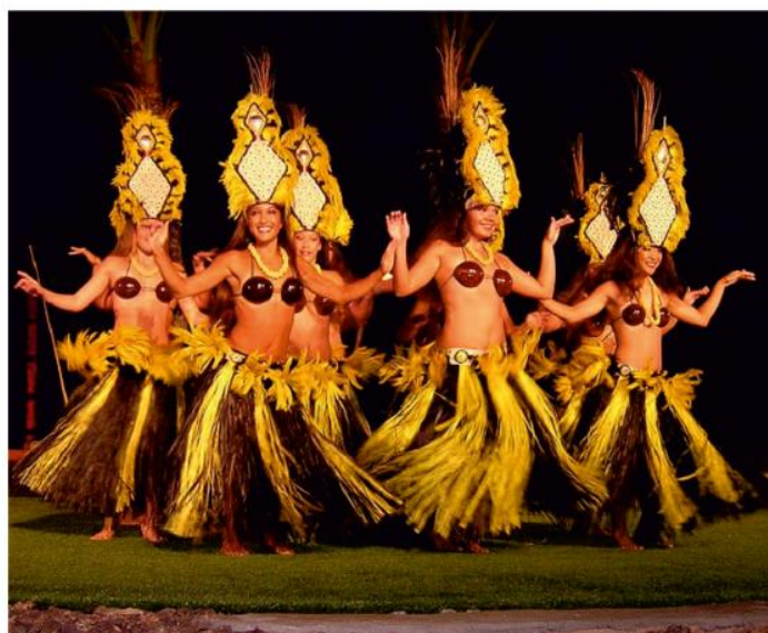
Hawajské Hula tanečnice.