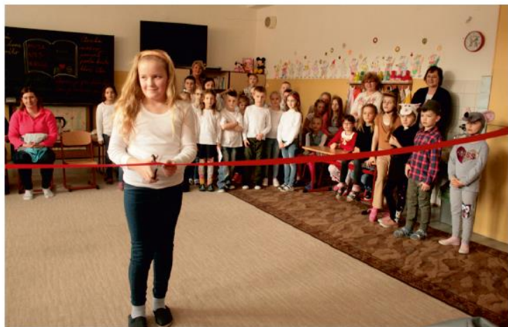
Prestrihnutie pásky bolo v rukách Sašky.