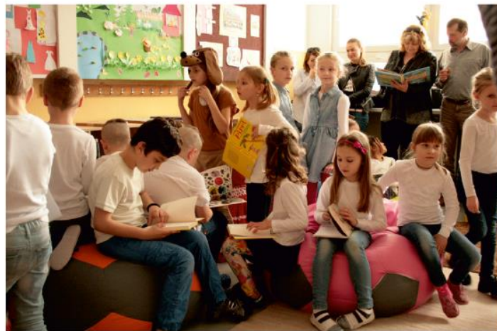
Čitateľský kútik bol v minúte obsadený deťmi.