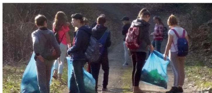
Školáci zo ZŠ Maurerova ulica čistili aj „panelovku“ v smere na Plejsy. Hneď pri ceste objavili aj vtáčie hniezdo s vajčekom.