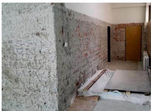
Rovnako aj steny pri vstupe do šatní.