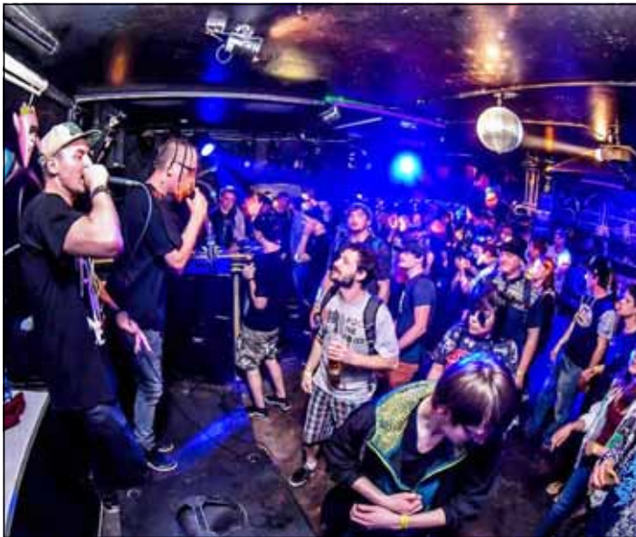
Tripl Cripl medzi fanúšikmi