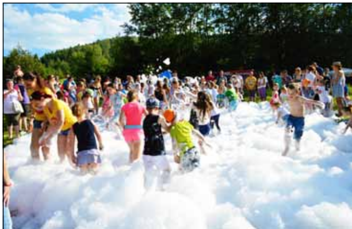
Penová šou Najviac pobavila malých oslávencov.

všetkých vekových kategórií sa mohli do sýtosti vyšantíť na atrakciách ako vodné bubliny, lodičky, skákacie hrady, či zasúfažiť si s animátormi v rôznych disciplínach. Hoci boli služobní „havkáči“ unavení z horúceho počasia, bravúrne zvládli ukážky služobnej kynológie Okresného riaditeľstva PZ v Spišskej Novej Vsi. Medzi deťmi sa určite našli aj zvedavci, ktorí si chceli prezrieť plazy z pojazdného terária, či budúci hasiči, ktorým zas učarovali hasičské autá. Nechýbalo ani tradičné maľovanie na tvár a čerešničkou na torte bola penová show pre všetky deti, ktorú pripravili