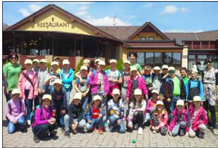
Školákom sa v Tatrách veľmi páčilo.

Škola v prírode sa konala v čase 15.– 19. mája 2017 v Novej Lesnej v hoteli Amália. Hotel sa nachádza na okraji obce Nová Lesná, s krásnym výhľadom na Vysoké Tatry. Školy v prírode sa zúčastnilo 30 žiakov z tried IV.A a IV.B spolu so 4 pedagogickými zamestnancami a zdravotníkom.