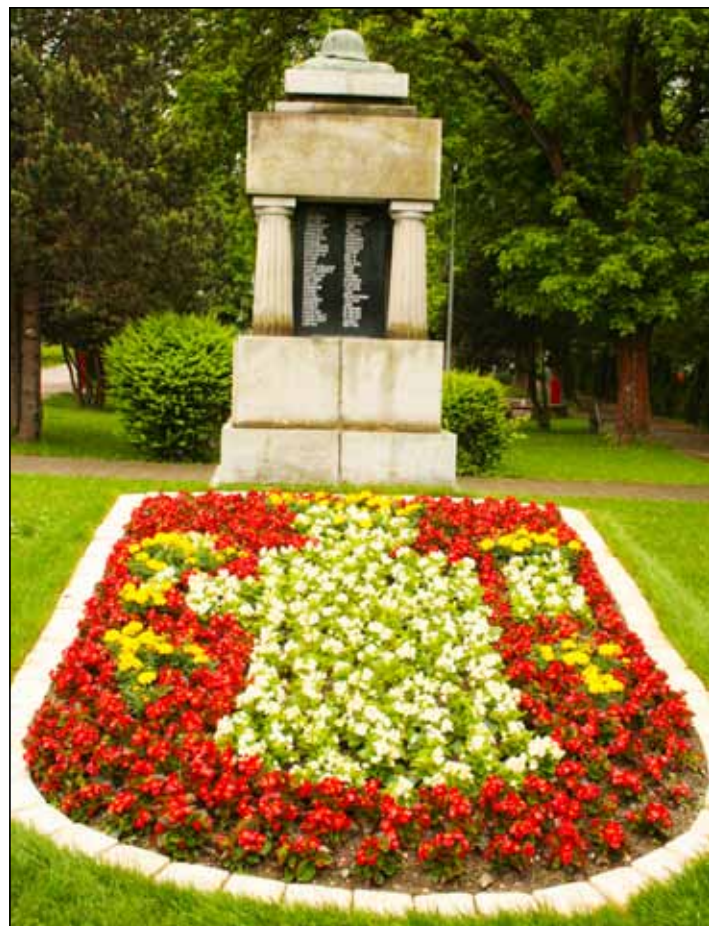
Erb v parku zakvitol begóniami.