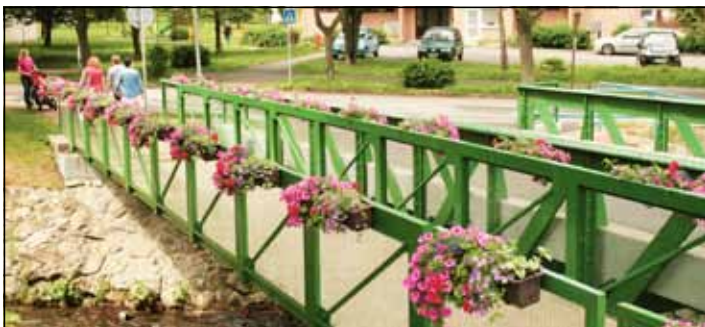
Kvetináče už tradične zdobia aj mosty.

Stalo sa už tradíciou, že s príchodom mája sa mesto okvetí. Ani tento rok nie je výnimkou. Pestrofarebné koberce už lemujú nie jeden zelený záhon. Tohtoročnou zaujímavosťou je kvetinový erb pri pamätníku padlých v mestskom parku. Hoci sa prvýkrát objavil už pred dvoma rokmi, svojím „3D stvárnením“ púta pozornosť už pri vstupe do parku.