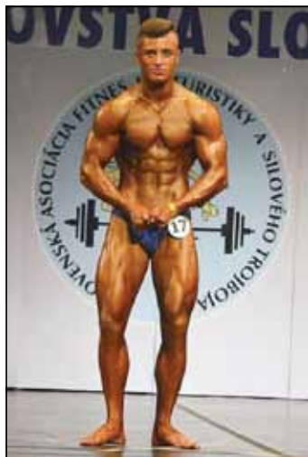
R. Tejbus v plnej paráde

Ako nám prezradil na Majstrovstvách SR išiel s jasným cieľom, dostať sa do TOP 3. „Na prvýkrát obsadiť druhé miesto je pre mňa perfektné,“ netajil nadšenie športovec. Ako mladý chalan vyskúšal viacero športov, ale najviac ho uchvátila práve kulturistika. Venuje sa jej od svojich 14 rokov. „Je to veľmi náročný šport. Voľný čas, ktorý