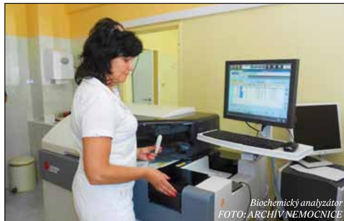
Biochemický analyzátor

Nemocnica Krompachy v týchto dňoch ukončila modernizáciu Oddelenia klinickej biochémie (OKB). Zveľadil sa existujúci vstup do priestorov OKB, vymenené boli vchodové dvere a štyri okná na oddelení. Zriadené bolo aj celkom nové sociálne zariadenie pre pacientov. Vďaka modernizácii za viac ako 8 000 EUR sa pacienti a zamestnanci môžu tešiť útulnejšiemu prostrediu.