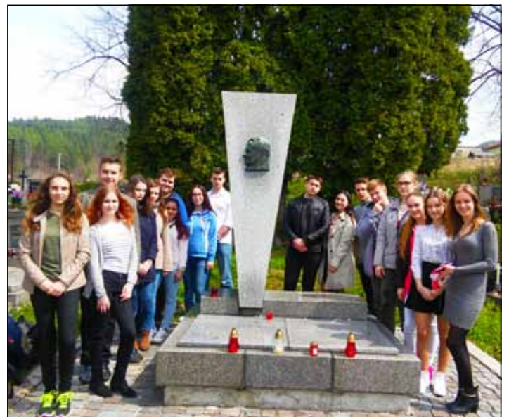
Mladí nezabúdajú na svojich rodákov.

Všetko podstatné o diani v meste, nájdete na webovej stránke mesta Krompachy