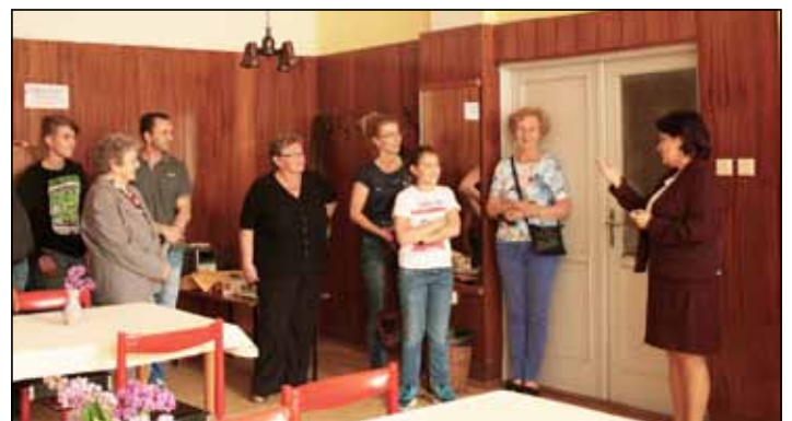
Na vernisáži nechýbala rodina, členky Únie žien aj primátorka mesta