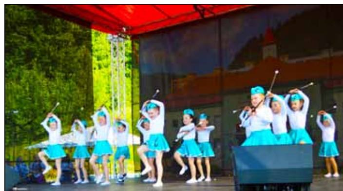
Festival tanca Ponúkol tanečnú všehochuť