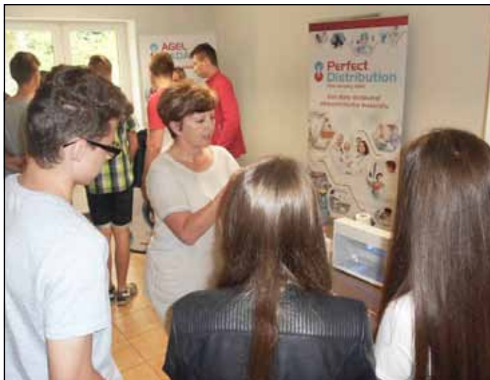
Študentov odborný výklad zaujal

Súčasnou DOD bola aj prezentácia práce NADÁCIE AGEL, ktorá prostredníctvom svojej