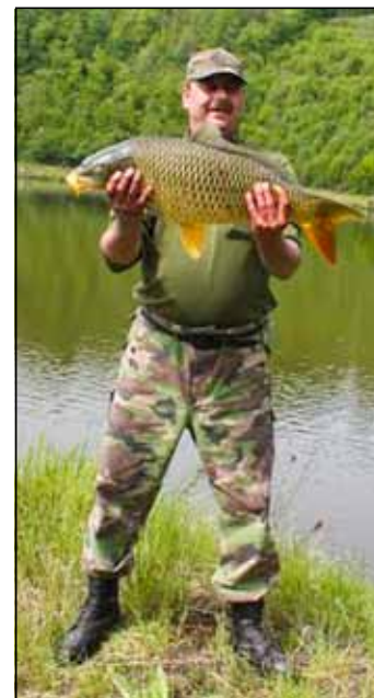
Najťažší kapor vážil 6,66 kg.