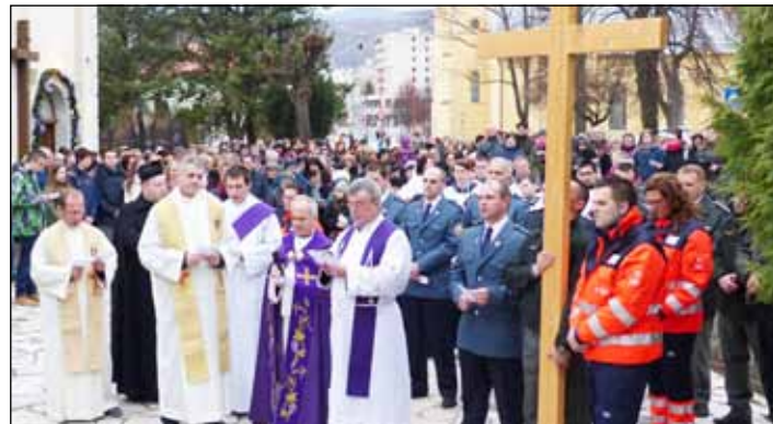
Krížová cesta policajta, hasiča, záchranára v uliciach mesta.

V našom živote sme tiež na ceste. Táto cesta má svoje zastavenia – životné situácie, keď sa musíme zamyslieť a prehodnotiť