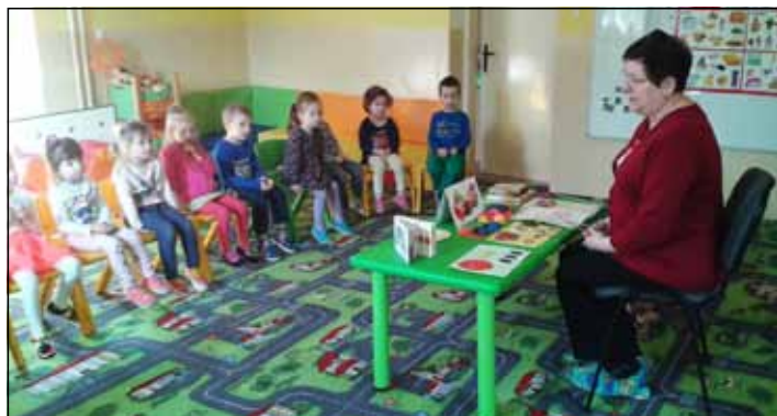
Deti prežili rozprávkové dopoludnie