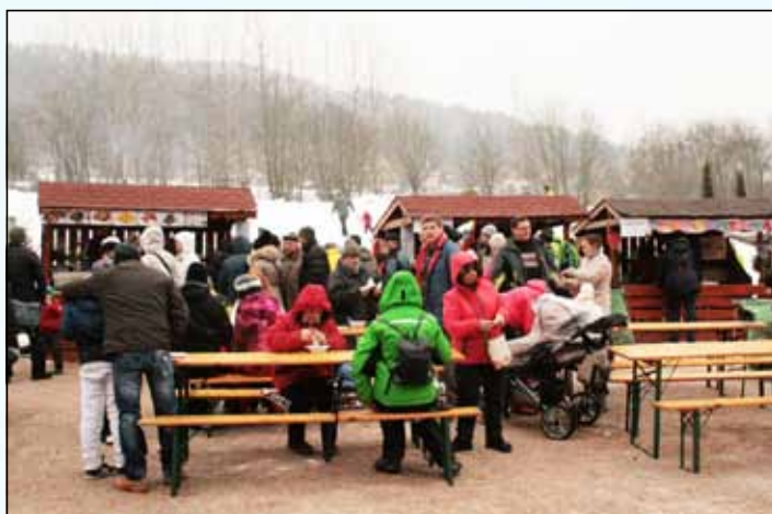
Pankuškové fašiangy sa tešia veľkej obľube.

Predveľkonočné obdobie karnevalov a zábavy sa v Krompachoch už niekoľko rokov spája s Pankuškovými fašiangami. Podujatie organizované mestom z roka na rok získava viac na popularite. Ani tento rok nebol výnimkou a počas dvoch víkendových dní prišlo na Plejsy vyše štyritisíc návštevníkov.