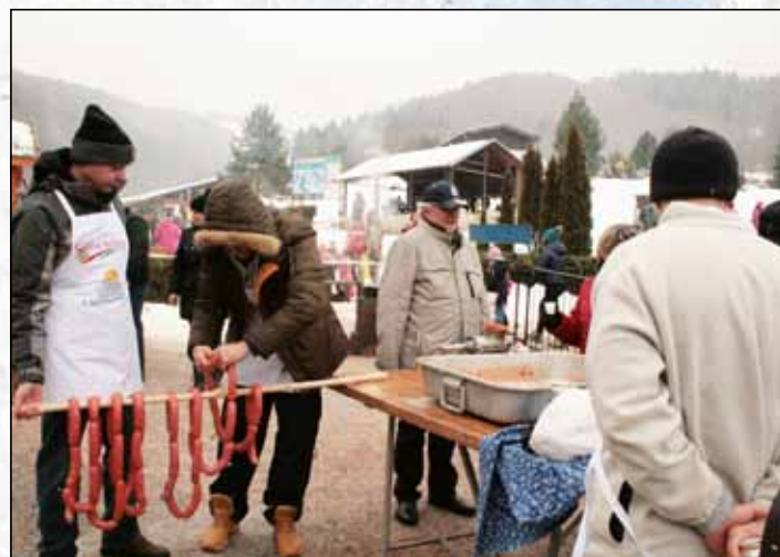
Majstri mäsiari pripravovali obľúbenú čabajku.