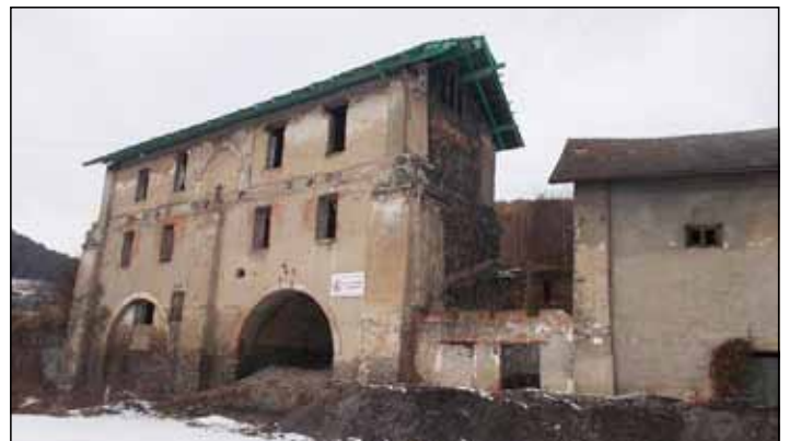
Súčasný stav hámra