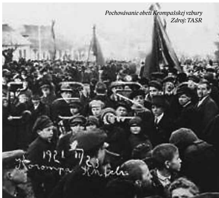
Pochovávanie obetí Krompašskej vzbury