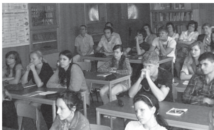
Otvorená hodina na chémii